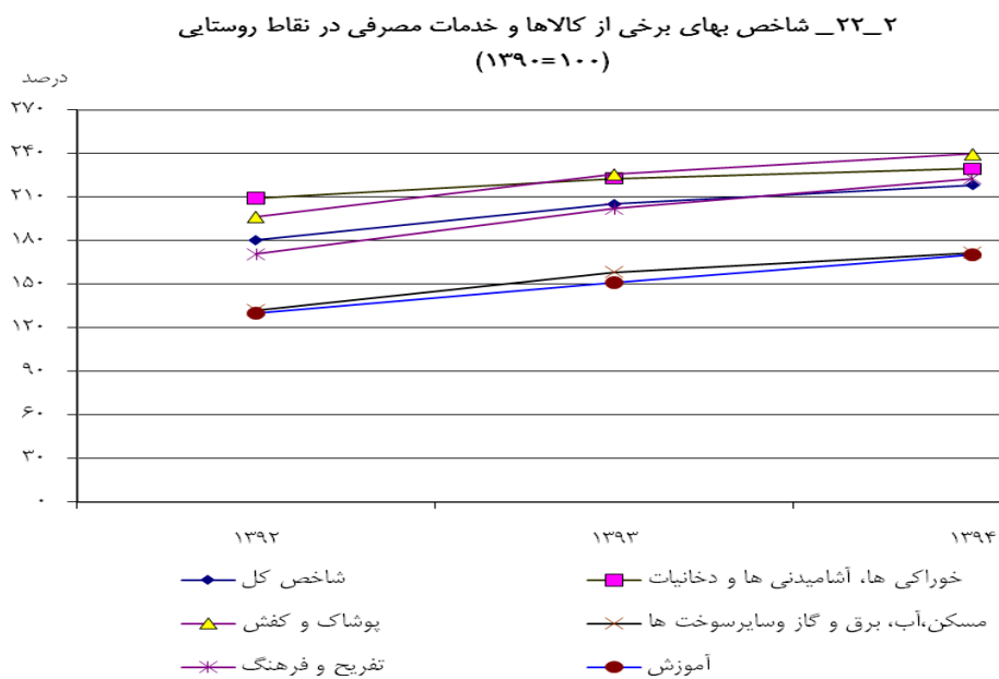
مینا جدول ۲ - ۲۲