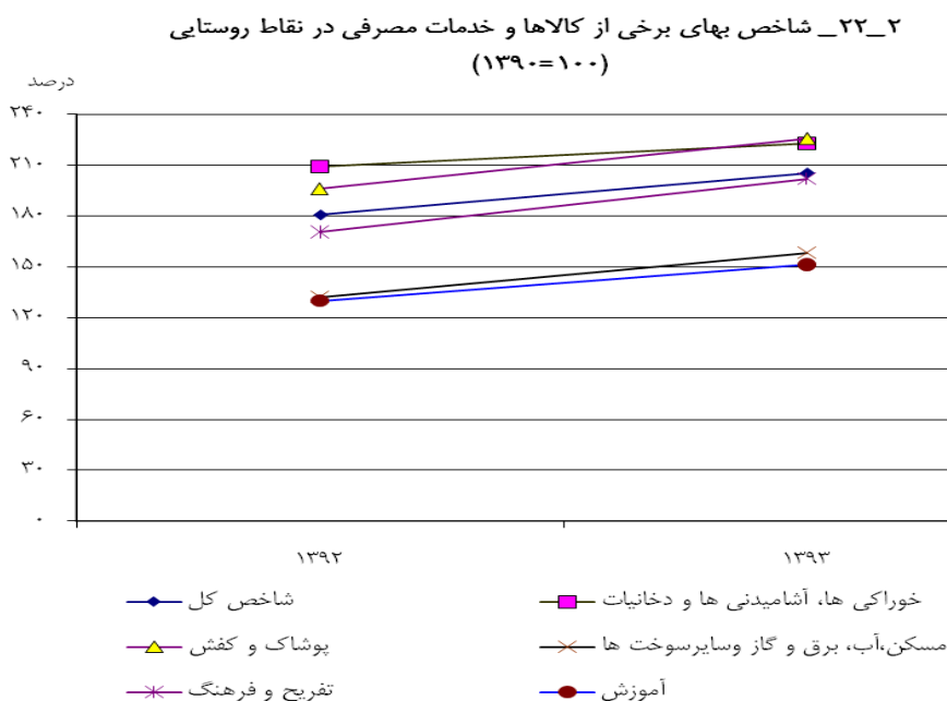
مبنا جدول ۲ - ۲۲