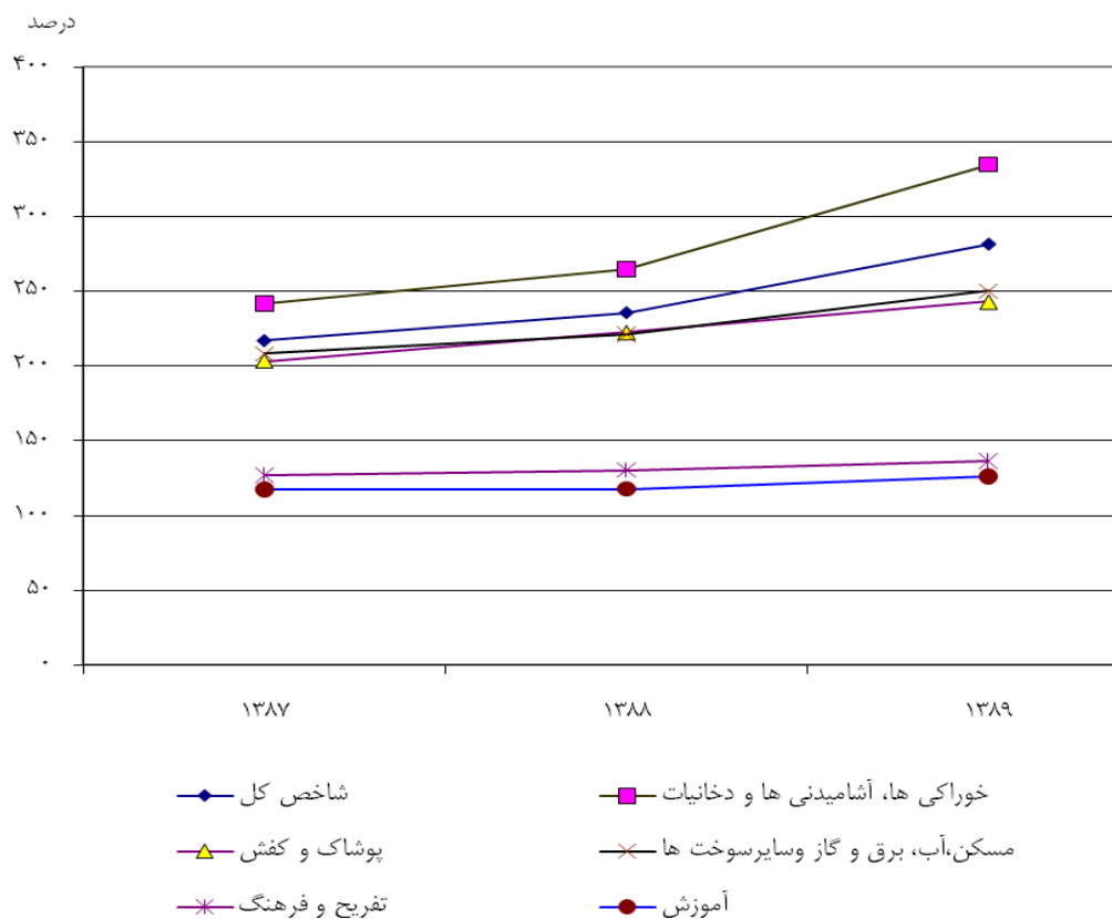
۲۱_۲_ شاخص بهای برخی از کالاها و خدمات مصرفی در نقاط روستایی ( ۱۳۸۱ = ۱۰۰ )